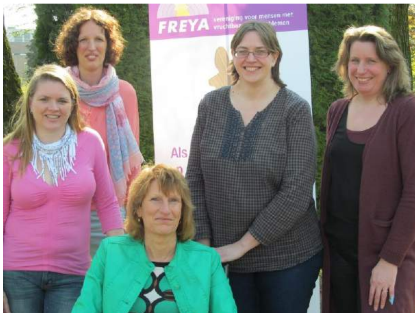
Bestuur Freya 2014